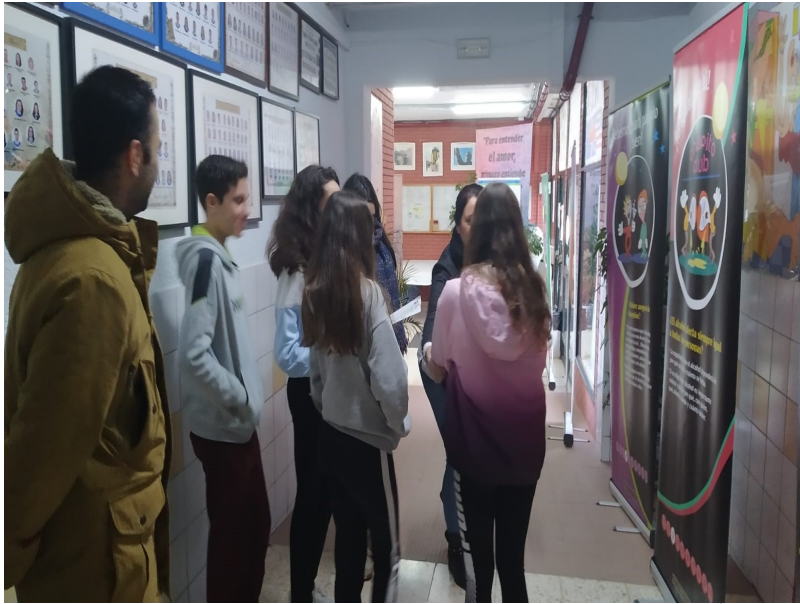
( http://www.alosno.es/export/sites/alosno/es/.galleries/imagenes-noticias/2019/responsabilidad.jpg )