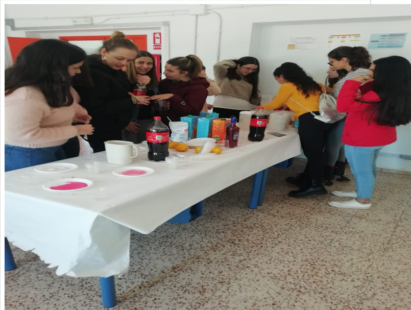
( http://www.alosno.es/export/sites/alosno/es/.galleries/imagenes-noticias/2019/alosnoantelasdrogas.jpg )