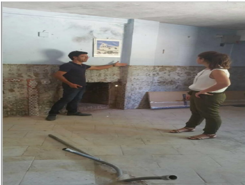
( http://www.alosno.es/export/sites/alosno/es/.galleries/imagenes-noticias/2016/Septiembre/3.jpg )