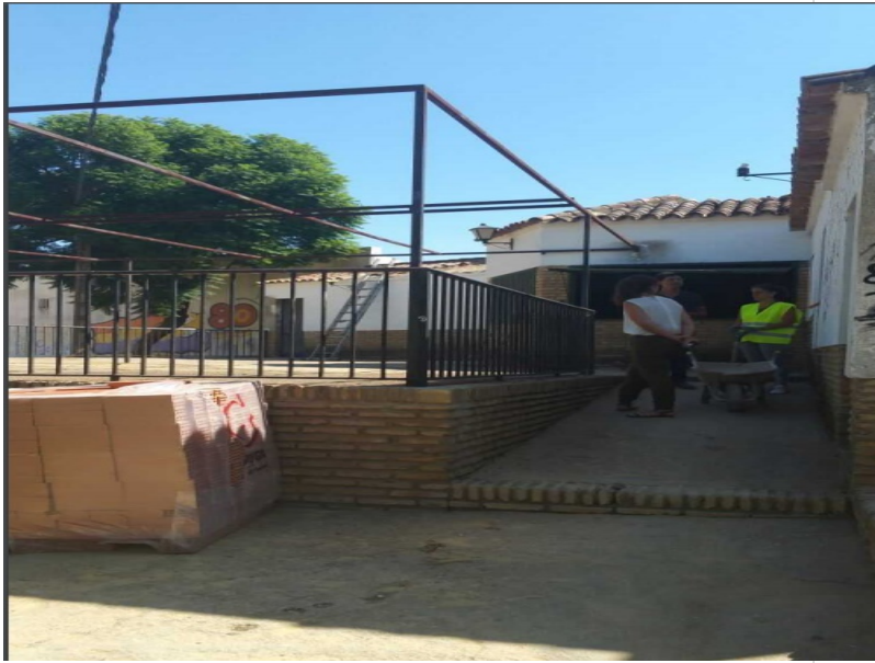
( http://www.alosno.es/export/sites/alosno/es/.galleries/imagenes-noticias/2016/Septiembre/4.jpg )